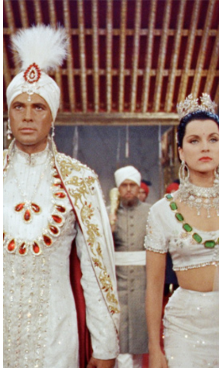
1959 LE TIGRE DU BENGALE (Der Tiger von Eschnapur) de Fritz Lang avec Paul Hubschmid