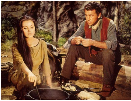
1956 LA DERNIÈRE CHASSE (The last Hunt) de Richard Brooks avec Stewart Granger