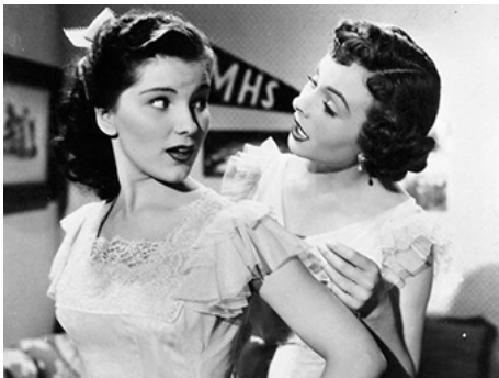
1952 SIX FILLES CHERCHENT UN MARI (Belles of their Toes) d'Henry Levin avec Jeanne Crain