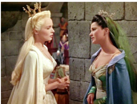
1954 PRINCE VAILLANT (Prince Valiant) d'Henry Hathaway avec Janet Leigh