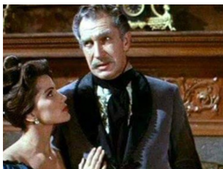
1962 L'EMPIRE DE LA TERREUR (Tales of Terror) de Roger Corman avec Vincent Price