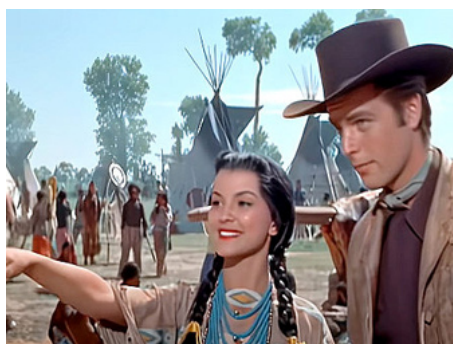
1955 LE DERNIER CHEYENNE (White Feather) de Robert D. Webb avec Robert Wagner