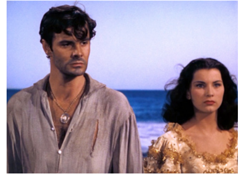
1951 LA FLIBUSTIÈRE DES ANTILLES (Anne of the Indies) de Jacques Tourneur avec Louis Jourdan