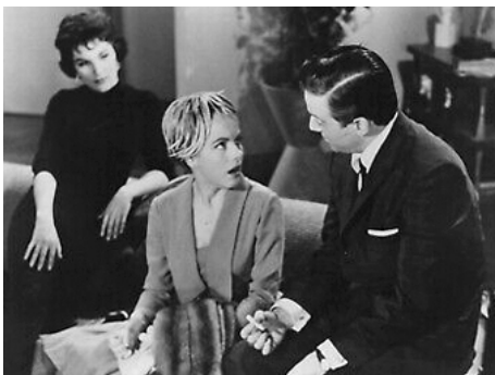
1960 WHY MUST I DIE ? de Roy del Ruth avec Terry Moore, Bert Freed