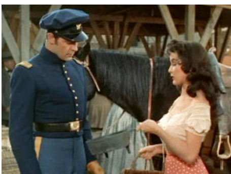
1954 LA SIRÈNE DE BÂTON-ROUGE (The Gambler from Natchez) d'Henry Levin avec Dale Robertson