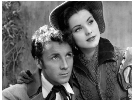
1952 LA VIE DE JEAN VALJEAN (Les Misérables) de Lewis Milestone avec Cameron Mitchell