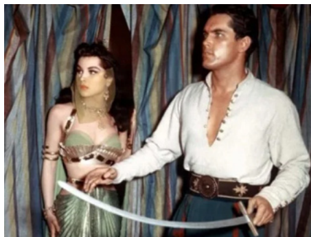
1954 LA PRINCESSE DU NIL (Princess of the Nile) d'Harmon Jones avec Jeffrey Hunter