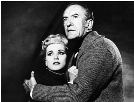
1958 DE LA TERRE À LA LUNE (From the Earth to the Moon) de Byron Haskin avec George Sanders