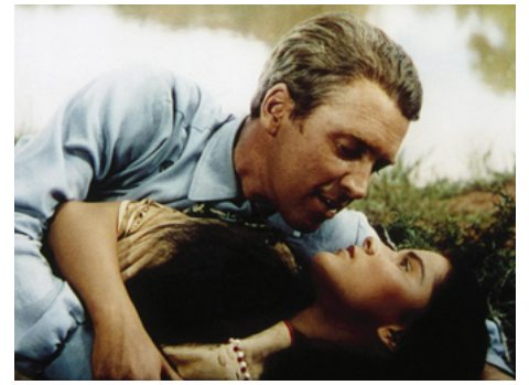
1950 LA FLÈCHE BRISÉE (Broken Arrow) de Delmer Daves avec Jeff Chandler, James Stewart