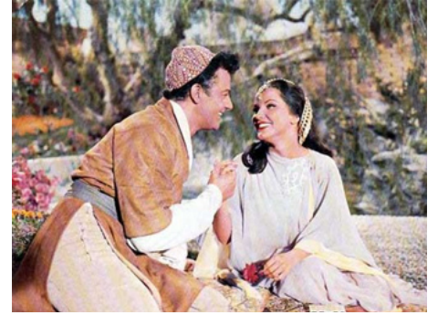
1957 LES AMOURS D'OMAR KHAYYAM (Omar Khayyam) de William Dieterle avec Cornel Wilde