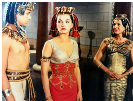
1960 LA VALLÉE DES PHARAONS (Il Sepolcro dei Re) de Fernando Cerchio avec Robert Alda