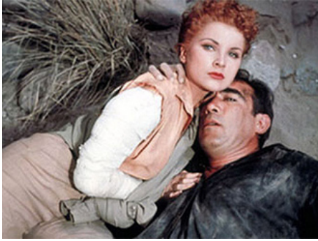
1957 LE BORD DE LA RIVIÈRE (The River's Edge) d'Allan Dwan avec Anthony Quinn