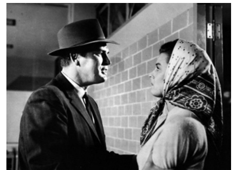
1961 ABATTEZ CET HOMME (Most dangerous Man alive) d'Allan Dwan avec Anthony Caruso