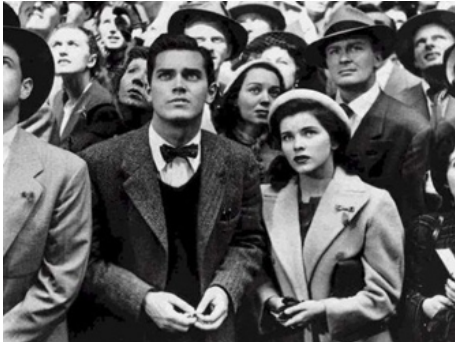
1951 QUATORZE HEURES (Fourteen Hours) d'Henry Hathaway avec Jeffrey Hunter