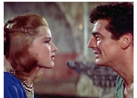
1954 LES GLADIATEURS (Demetrius and the Gladiators) de Delmer Daves avec Victor Mature