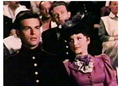
1953 LA PARADE DE LA GLOIRE (Stars and Stripes Forever) d'Henry Koster avec Robert Wagner