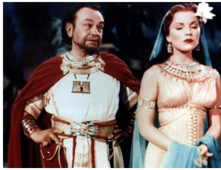
1956 LES DIX COMMANDEMENTS (The ten Commandments) de Cecil B. DeMille avec Edward G. Robinson