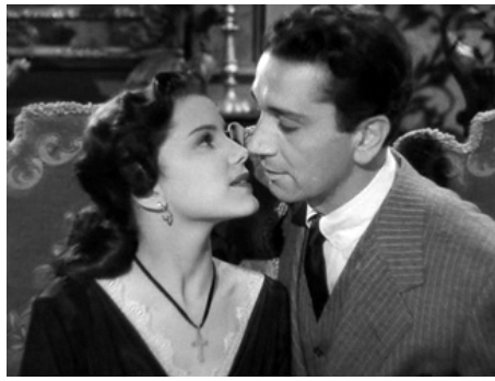
1949 LA MAISON DES ÉTRANGERS (House of Strangers) de Joseph L. Mankiewicz avec Richard Conte