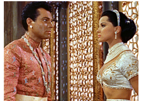
1959 LE TOMBEAU HINDOU (Das indische Grabmal) de Fritz Lang avec Walther Reyer