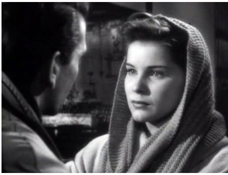
1948 LA PROIE (Cry of the City) de Robert Siodmak avec Richard Conte