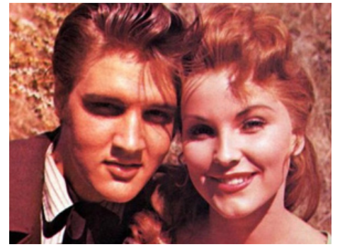
1956 LE CAVALIER DU CRÉPUSCULE (Love me tender) de Robert D. Webb avec Elvis Presley