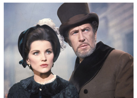
1963 LA MALÉDICTION D'ARKHAM (The Haunted Palace) de Roger Corman avec Vincent Price