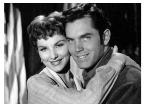
1955 SEVEN ANGRY MEN de Charles Marquis Warren avec Jeffrey Hunter