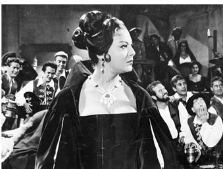
1961 LES BRIGANDS (I Masnadieri) de Mario Bonnard